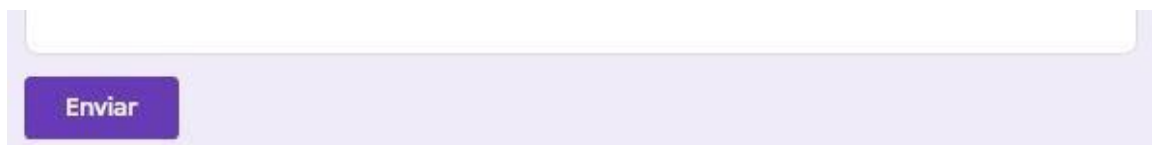
Figura EV.3 Validación de Elección

3° Paso: El elector debe hacer Click en el botón “enviar” como se puede observar en la figura EV.3 Enviar.